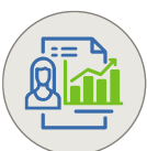
GESTIÓN DEL DESEMPEÑO